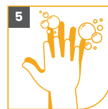
5 ENTRE LOS DEDOS