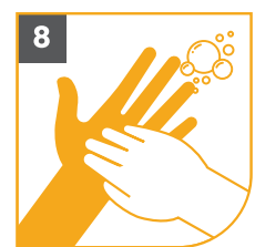
8 LAS UÑAS