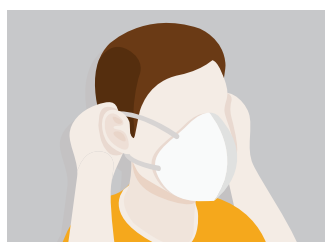
2. Cubre tu nariz, boca y barbilla.