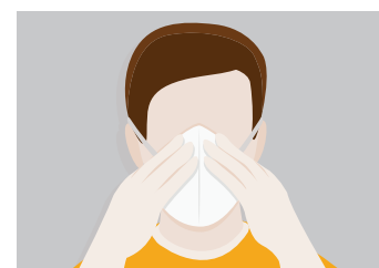
3. Amolda la mascarilla alrededor de tu nariz.