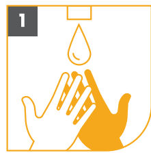
1 MOJA TUS MANOS

¡Crea tu propia canción para lavarte las manos escribiendo la letra de tu canción favorita en las líneas de abajo!