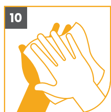
10 SÉCALAS BIEN