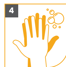
4 LAVA EL DORSO DE TUS MANOS