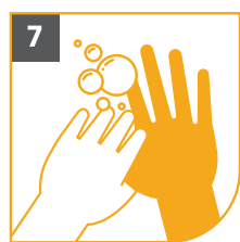
7 LOS PULGARES