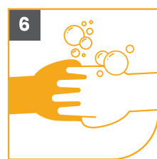
6 LOS NUDILLOS