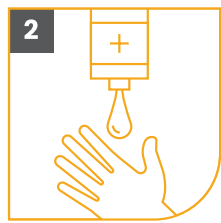
2 APLICA JABÓN