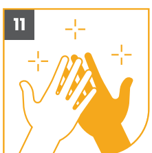
11 TUS MANOS ESTÁN LIMPIAS