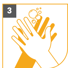
3 LAVA LAS PALMAS DE TUS MANOS (PALMA A PALMA)

¡Enjabónate las manos por al menos 20 segundos!